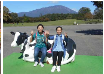
大自然をバックに (小岩井農場)