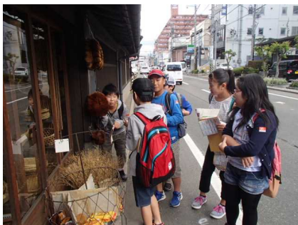
知らない町を (自主研修)