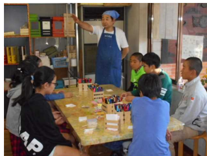
手作り体験 (手作り村)