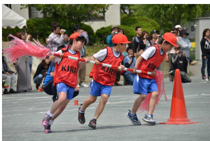
1・2・3年生「まきおこせ! タイフーン」