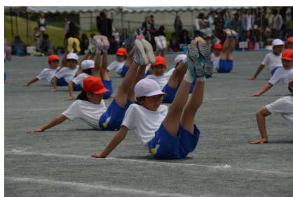
3・4年生「かがやけ 命の力」