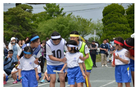
紅白対抗リレー「1年生に教える6年生」