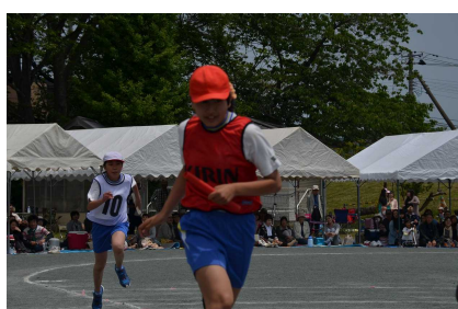
5・6年生「オールメンバーリレー」