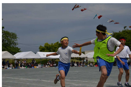
紅白対抗リレー「精一杯のバトンパス」