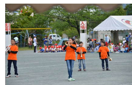
マーチング「レッツ エンjoy ミュージック♪」