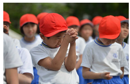
成績発表「赤組が勝ちますように」