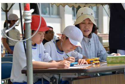
記録係「陰で支えたる」